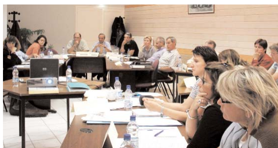
Un groupe de travail

Communication avec les entreprises. - Envoyer des bilans sur le nombre de stagiaires accueillis en stage par exemple.