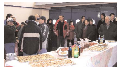
Derniers préparatifs... avant l'ouverture et l'inauguration, le 1er février