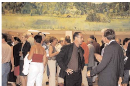
Lors du cocktail