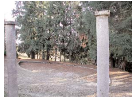
La pergola domine une pièce d'eau ombragée. La "musique" d'une petite cascade incite à la détente, à la relaxation...

De très vieux Thuyas, dont les troncs sont magnifiques, délimitent la Pergola (partie haute) de la pièce d'eau.